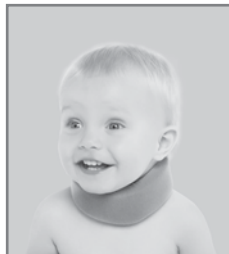
Таблица размеров для подбора бандажа Orlett на шейный отдел для детей до 1-го года.