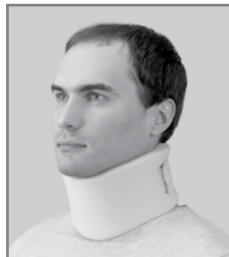
Таблица размеров для подбора бандажа Orlett на шейный отдел для взрослых.

БН6-53-8-1, БН6-53-8-2, БН6-53-9-1, БН6-53-9-2, БН6-53-10-1, БН6-53-10-2, БН6-53-11-1, БН6-53-11-2, БН6-53-12-1, БН6-53-12-2.